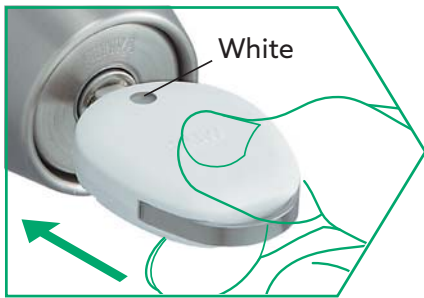
①キーをカギ穴に挿入して、少し押し込むようにして回します。

カギを操作すると表示窓の色が変わるので、視覚的にカギの開け閉めの状態をチェックできます。