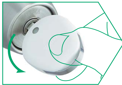
②キーを90度回して施錠・解錠操作をします。*